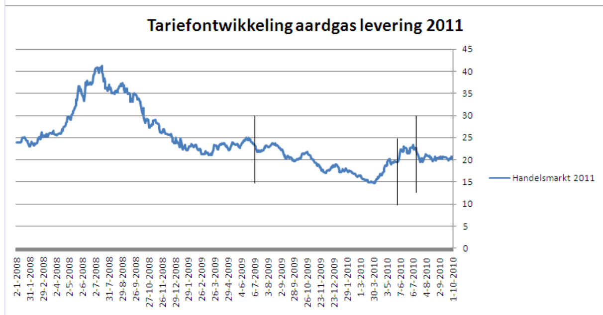
Tabel en grafiek 2. Inkoopmomenten aardgas 2011