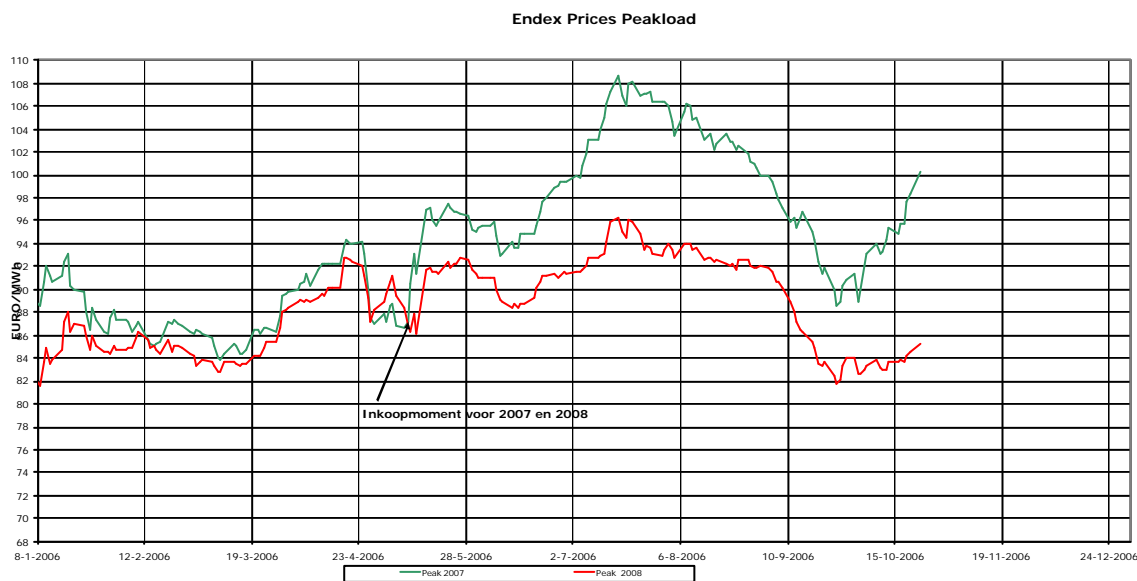
Grafiek 1. Verloop tarieven peak